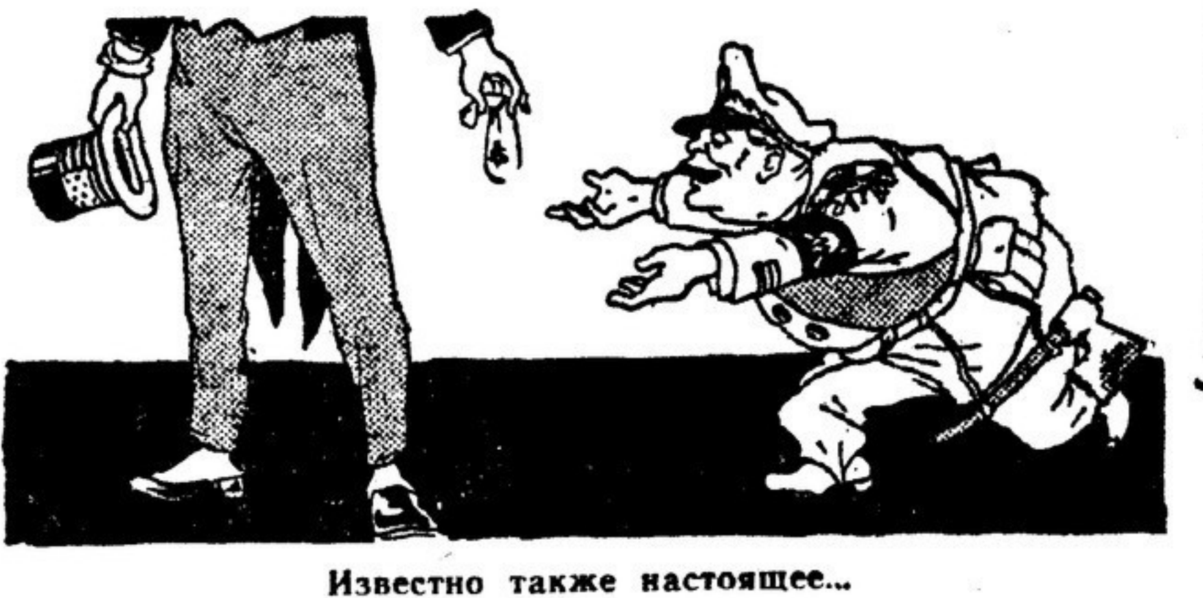
Известно также настоящее...