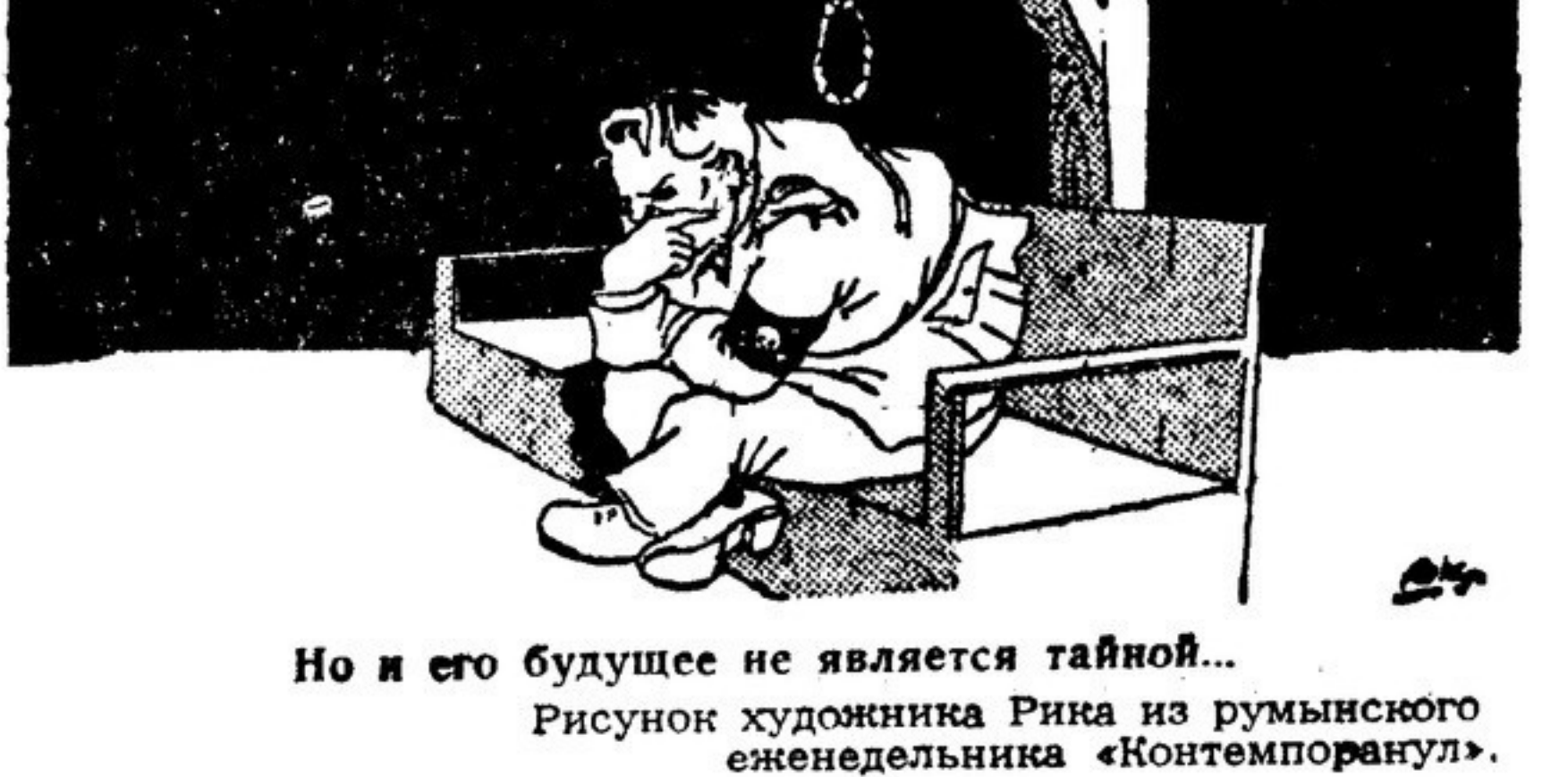
Но и его будущее не является тайной...