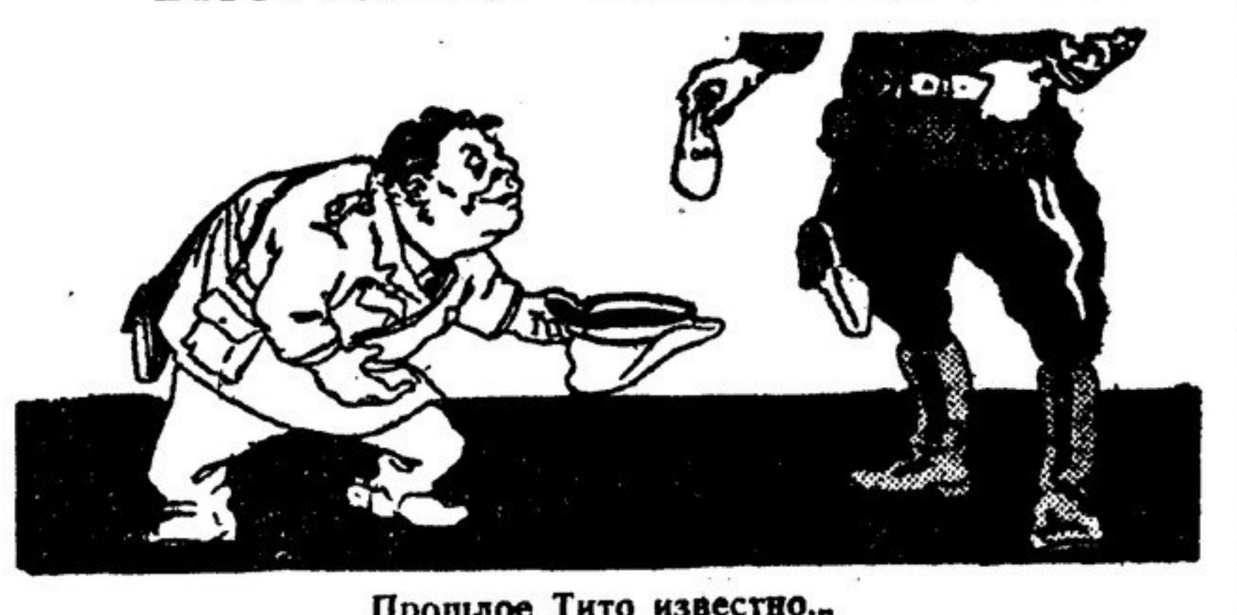
Прошлое Тито известно...