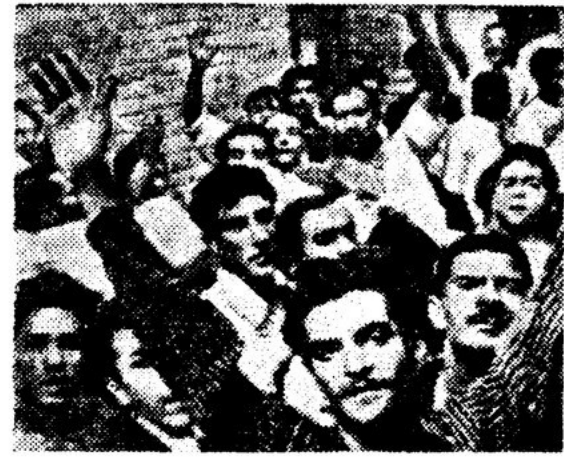
Демонстрация сторонников мира в столице Ирана — Тегеране.

— Салам алейку! — Алейку салам! Так приветствуют друг друга при встрече люди на Ближнем Востоке. По-арабски «салам» — это значит мир. Для десятков миллионов людей на Ближнем Востоке это привычное слово — салам — выражает их горячее стремление к миру, к свободе и национальной независимости.